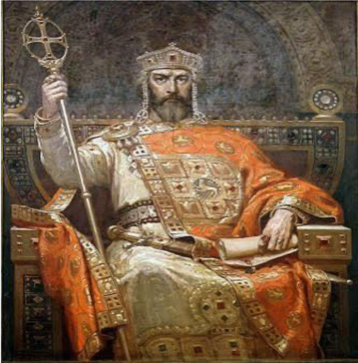
ΑΥΤΟΚΡΑΤΩΡ ΒΑΣΙΛΕΙΟΣ Β΄ Ο ΒΟΥΛΓΑΡΟΚΤΟΝΟΣ.

ΚΑΤΑ ΤΗ ΔΙΑΡΚΕΙΑ ΤΟΥ ΥΠΕΡΤΡΙΑΚΟΝΤΑΕΤΟΥΣ ΠΟΛΕΜΟΥ ΤΟΥ ΕΝΑΝΤΙΩΝ ΤΩΝ ΒΟΥΛΓΑΡΩΝ ΓΥΡΩ ΣΤΟ 1000 Μ.Χ. ΟΙ ΑΡΒΑΝΙΤΕΣ ΕΠΑΙΞΑΝ ΠΡΩΤΕΥΟΝΤΑ ΡΟΛΟ. ΑΝΑΔΕΙΧΤΗΚΕ Ο ΜΕΓΑΣ ΔΟΜΕΣΤΙΧΟΣ ΤΩΝ ΣΧΟΛΩΝ ΤΗΣ ΔΥΣΕΩΣ ΣΤΡΑΤΗΓΟΣ ΑΡΙΑΝΙΤΗΣ (=ΑΡΒΑΝΙΤΗΣ. ΠΡΟΓΟΝΟΣ ΤΟΥ ΓΕΩΡΓΙΟΥ ΣΠΑΤΑ ΑΡΙΑΝΙΤΗ ΓΚΟΛΕΜΗ ΠΑΤΡΟΣ ΤΗΣ ΑΝΔΡΟΝΙΚΗΣ ΚΟΜΗΝΟΥ ΣΥΖΥΓΟΥ ΤΟΥ Γ. ΚΑΣΤΡΙΩΤΗ). ΟΙ ΒΟΥΛΓΑΡΟΙ ΟΙ ΟΠΟΙΟΙ ΕΚΑΝΑΝ ΕΠΙΔΡΟΜΕΣ ΜΕΧΡΙ ΚΑΙ ΤΗΝ ΠΕΛΟΠΟΝΝΗΣΟ ΣΤΟ ΤΕΛΟΣ ΜΟΛΙΣ ΕΒΛΕΠΑΝ ΤΑ ΑΥΤΟΚΡΑΤΟΡΙΚΑ ΣΤΡΑΤΕΥΜΑΤΑ ΝΑ ΠΛΗΣΙΑΖΟΥΝ ΕΤΡΕΠΟΝΤΟ ΕΙΣ ΑΤΑΚΤΟ ΦΥΓΗ ΡΙΧΝΟΝΤΑΣ ΤΑ ΟΠΛΑ ΤΟΥΣ ΚΑΙ ΦΩΝΑΖΟΝΤΑΣ «ΜΠΕΖΗΤΕ ΤΣΕΖΑΡ != ΦΥΓΕΤΕ Ο ΑΥΤΟΚΡΑΤΩΡ !»