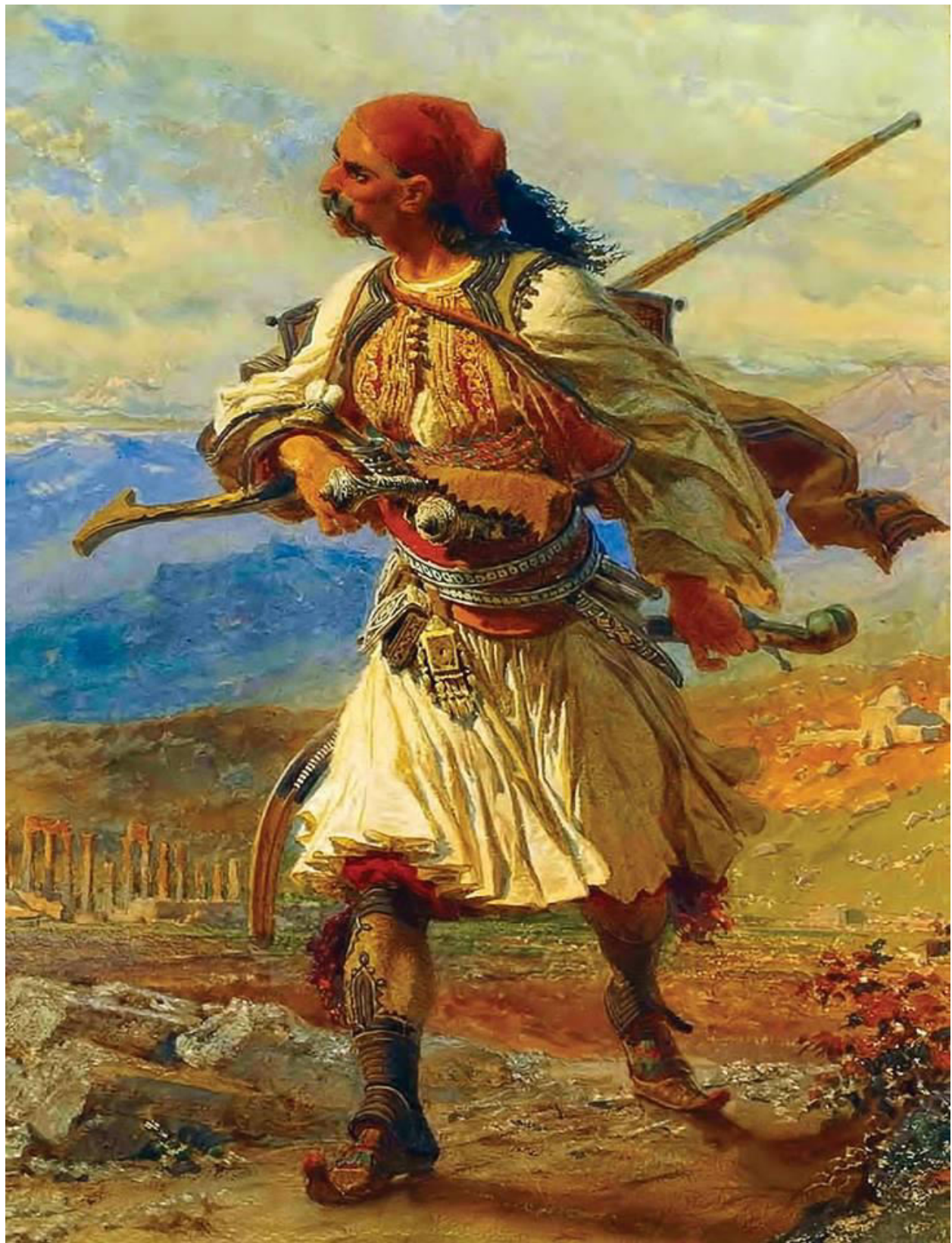
ΑΡΒΑΝΙΤΗΣ ΠΟΛΕΜΙΣΤΗΣ. ΗΑΑΓ 1861. ΜΟΥΣΕΙΟ ΜΠΕΝΑΚΗ