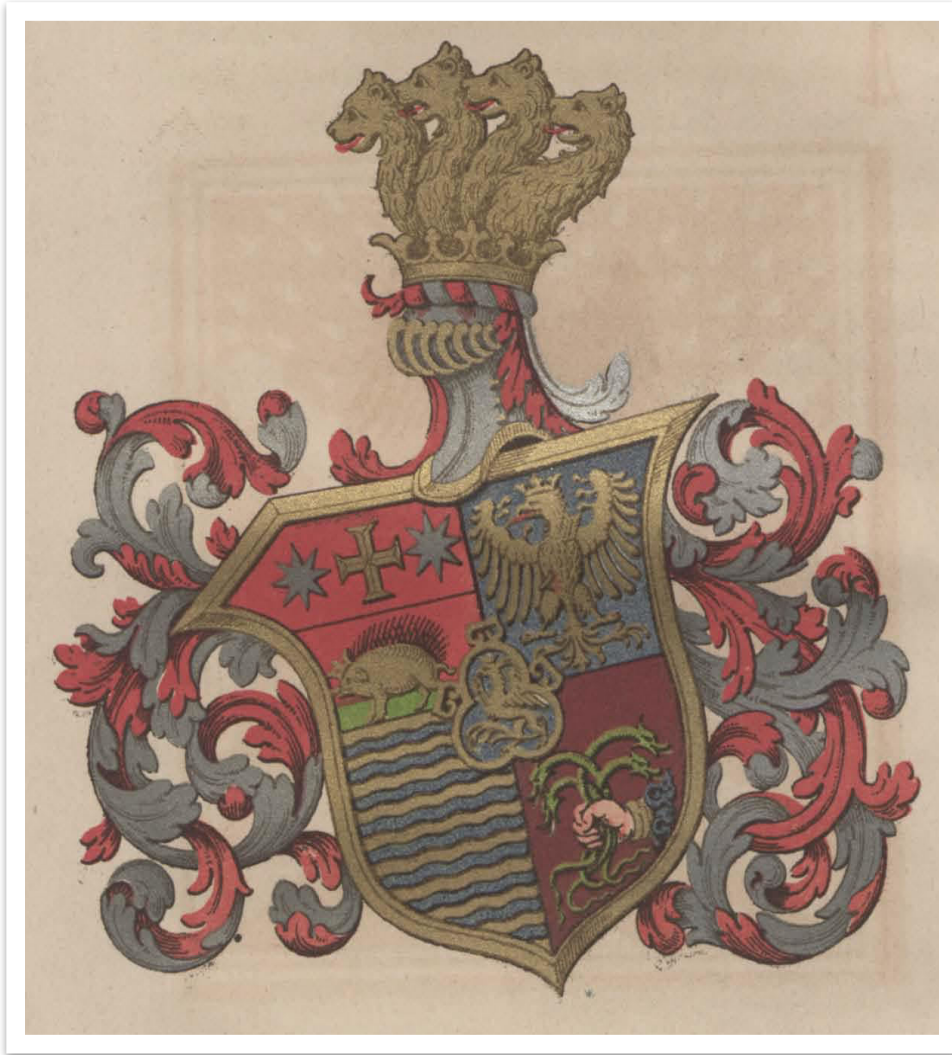
ΟΙΚΟΣΗΜΟ ΟΙΚΟΓΕΝΕΙΑΣ ΜΠΟΥΑ ΣΠΑΤΑ

ΔΙΑΦΟΡΕΣ ΦΡΑΣΕΙΣ ΕΞΟΙΚΕΙΩΣΗΣ ΑΠΟ ΤΗ ΜΕΛΕΤΗ ΤΟΥ ΓΕΝΙΚΟΥ ΑΡΧΙΑΤΡΟΥ ΤΟΥ ΒΑΣΙΛΙΚΟΥ ΠΟΛΕΜΙΚΟΥ ΝΑΥΤΙΚΟΥ ΚΑΡΟΛΟΥ ΡΕΪΝΟΛΔΟΥ «ΠΕΛΑΣΓΙΚΑ-Η ΔΙΑΛΕΚΤΟΣ ΤΟΥ ΣΤΟΛΟΥ-ΥΔΡΑ- ΣΠΕΤΣΕΣ-ΠΟΡΟΣ- 1855 ΑΘΗΝΑΙ» ΚΑΙ ΑΠΟ ΠΕΡΙΟΧΕΣ ΒΑ ΑΤΤΙΚΗΣ