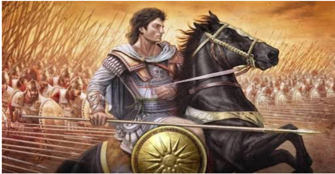
ΑΛΕΞΑΝΔΡΟΣ Ο ΜΕΓΑΣ

Πελασγική Γλώσσα, και αυτοίαι ή ανδρειότερα Πελασγική φυλή, ή φυλή τών γιγάντων και τιτάων' και μήν άμφισβόλησι ποσώς, ότι αύτή έστιν ή φυλή ή άπαρτιζουσα άλλοτε τής Ελλά- μιας φαλαγγας τής Μακεδονίας, αίτιναι άνέδειξαν μέγαν τόν Μα- κεδόνικ' Αλέξανδρον'