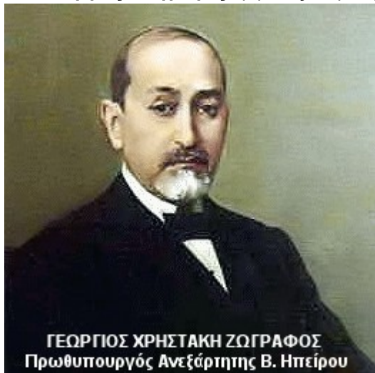
ΓΕΩΡΓΙΟΣ ΧΡΗΣΤΑΚΗ ΖΩΓΡΑΦΟΣ Πρωθυπουργός Ανεξάρτητης Β. Ηπείρου

Ο Γεώργιος Ζωγράφος, γεμάτος συγκίνηση και ευθύνες, έφτασε στο Αργυρόκαστρο και σχημάτισε την ιστορική «Προσωρινή Κυβέρνηση της Αυτονομίου Ηπείρου»!